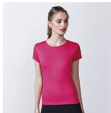
MONTECARLO WOMAN CA0423