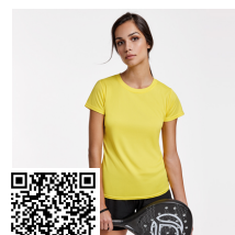
MONTECARLO WOMAN CA0423