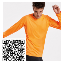
MONTECARLO L/S CA0415