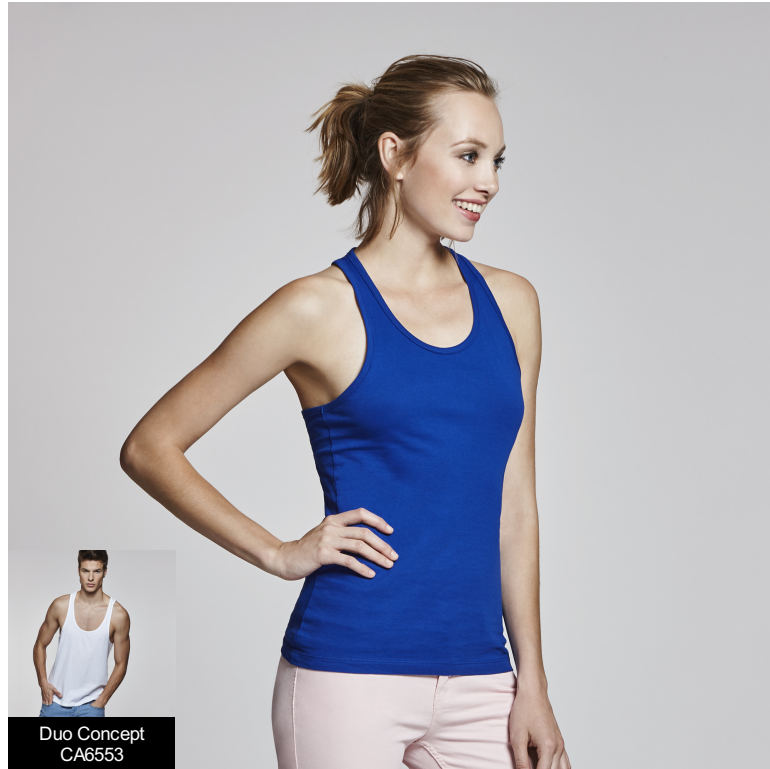
Duo Concept CA6553