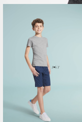
REGENT FIT KIDS 01183